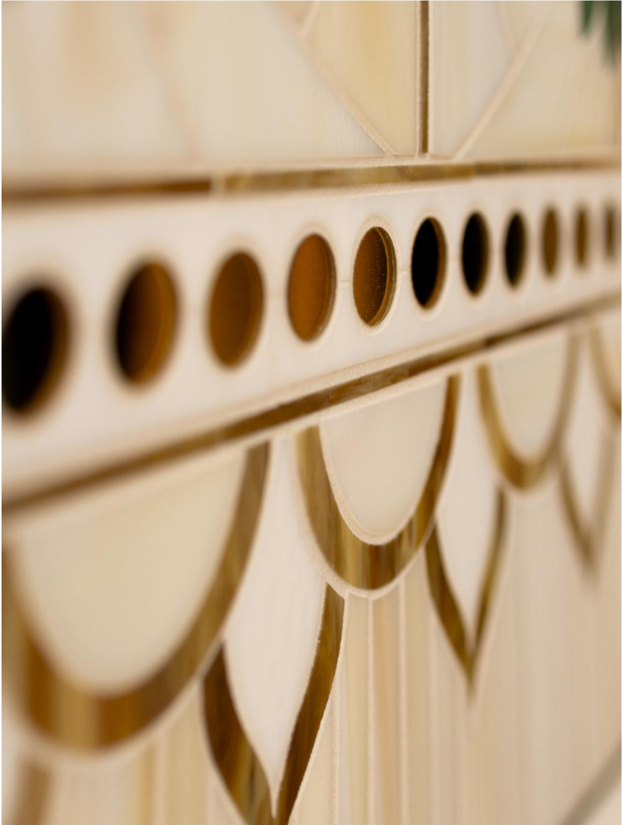
Marqueterie de verre – Projet Oasis – Atelier Myriam Hubert