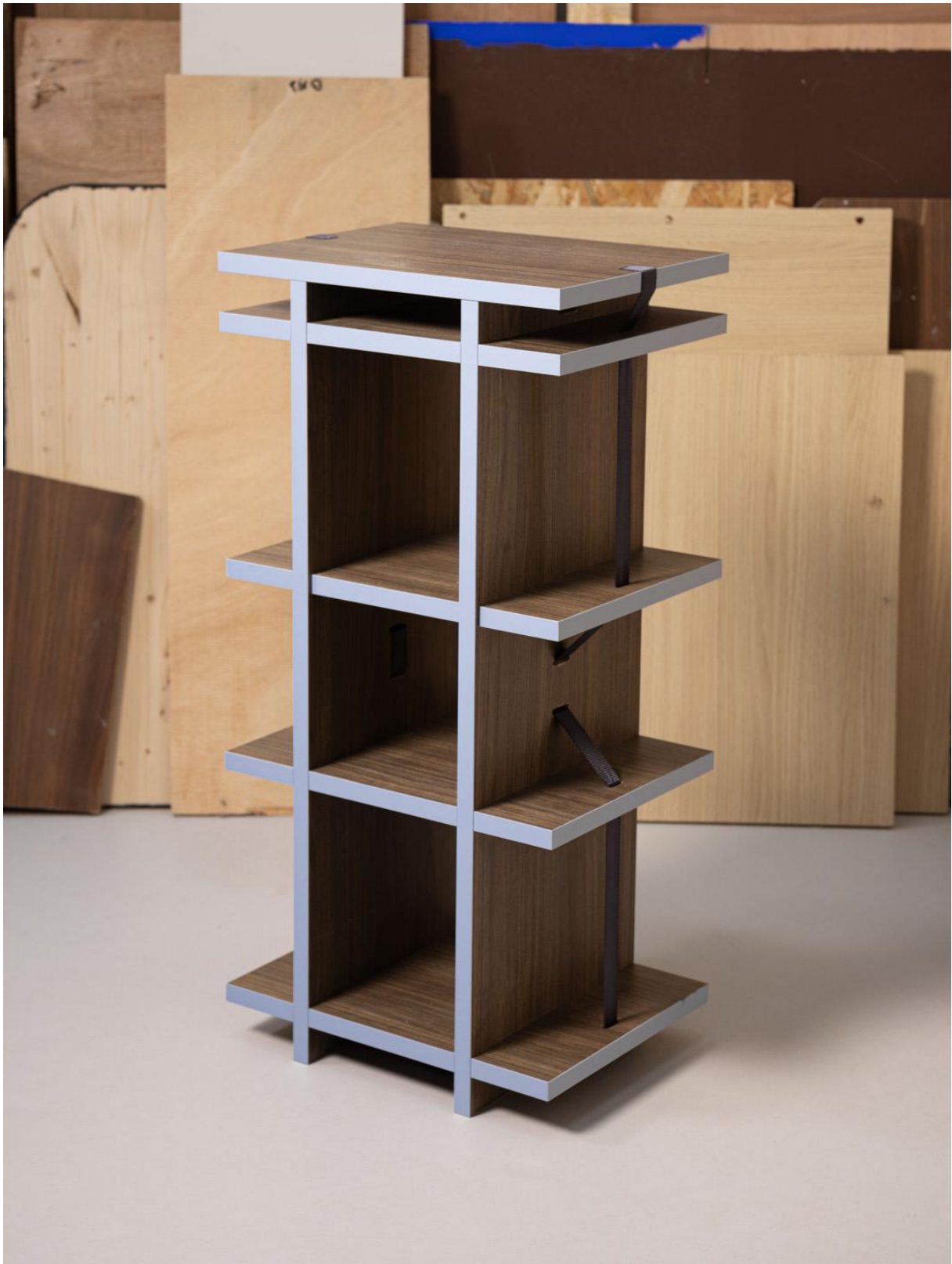
Colonne - édition Décors, n°0-02 - Panneaux de particules revêtus, chant ton sur ton ou contrastant. – Valérie Douang