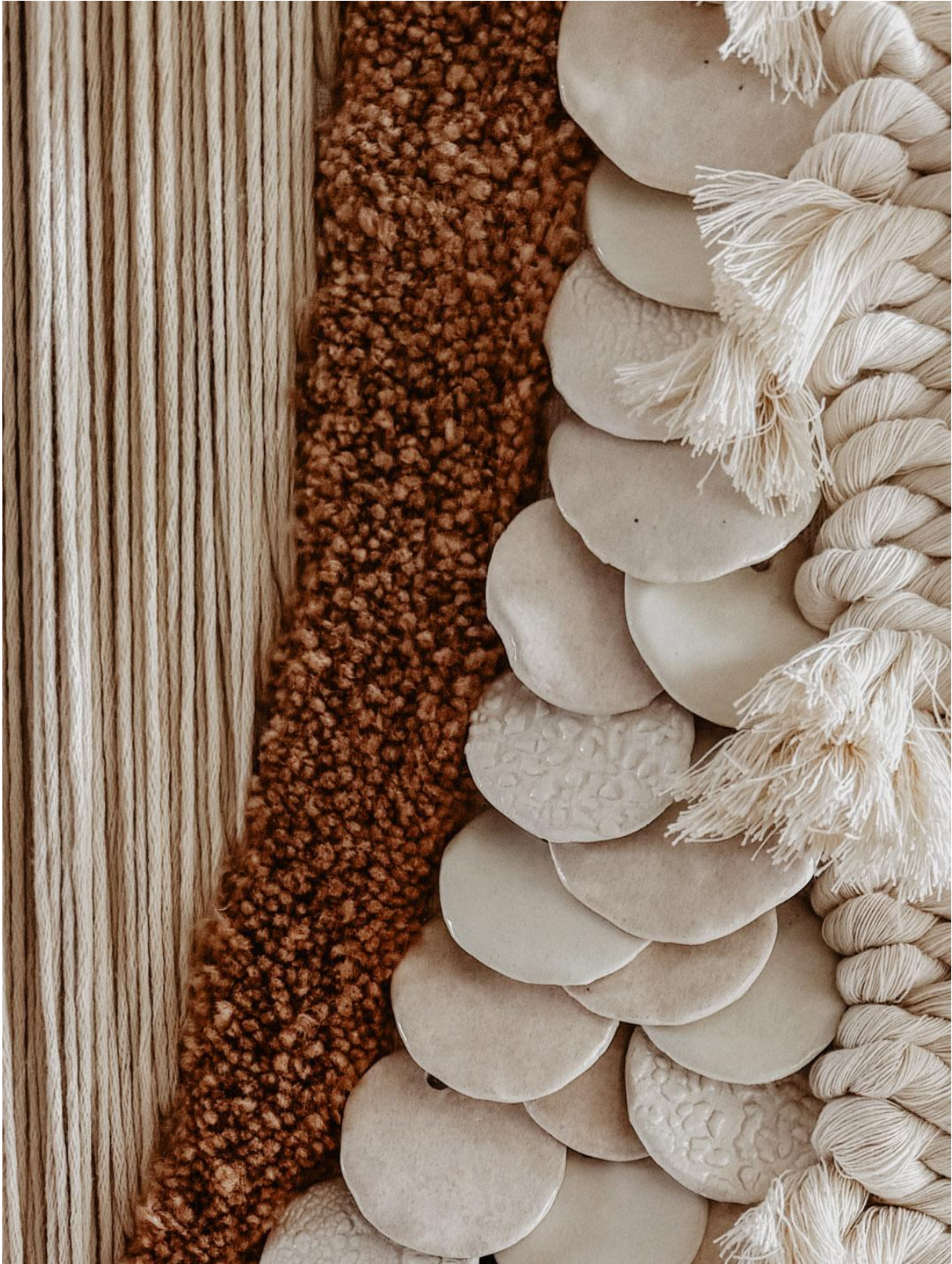
Détail tableau – technique mixe – Julie Robert