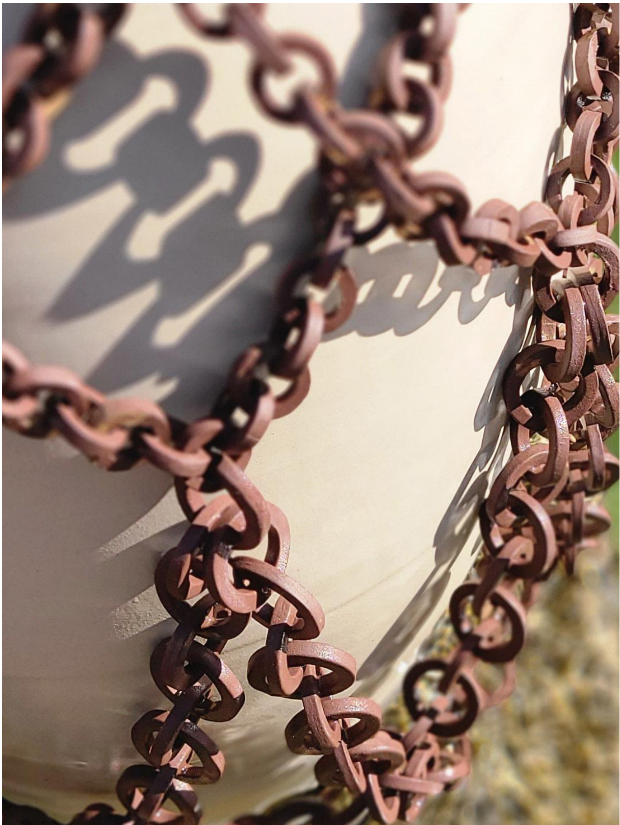
Gros vase enchaîné – Caroline Mary – Fictile Ceramic