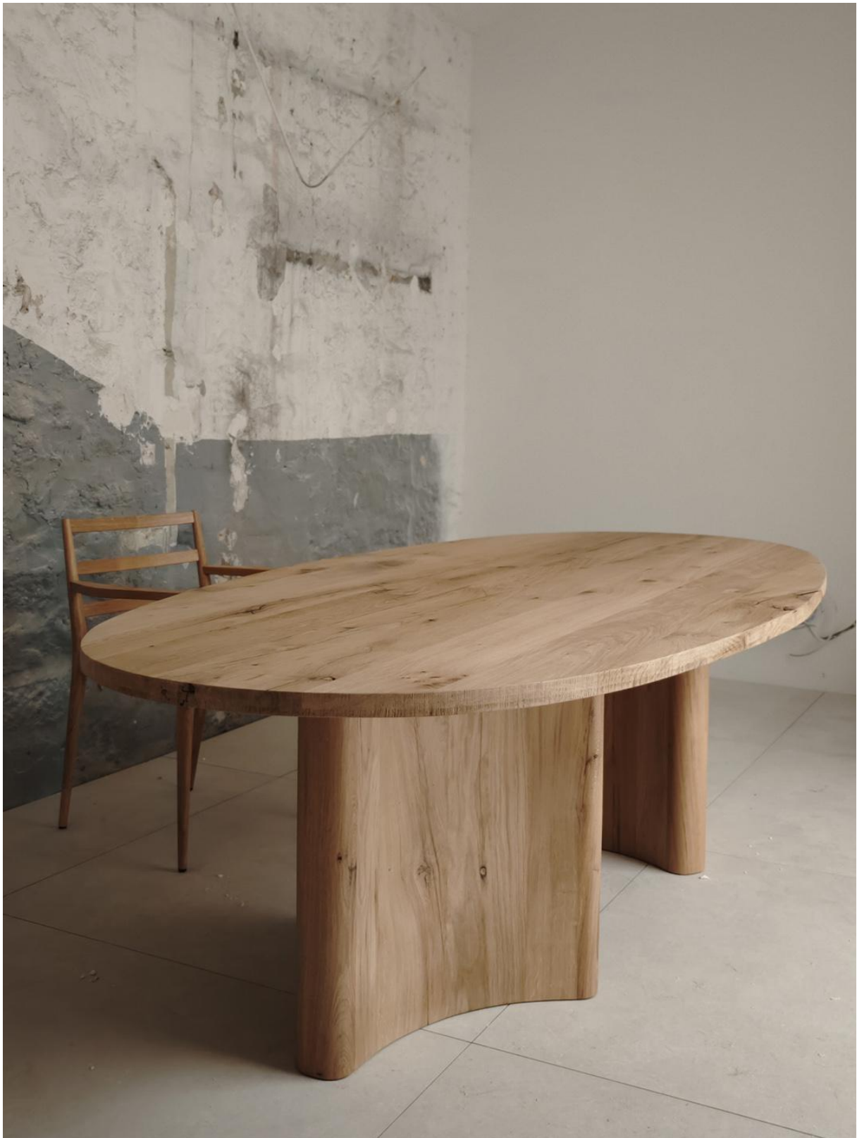
Table en chêne ancien raboté – Laurent Passe