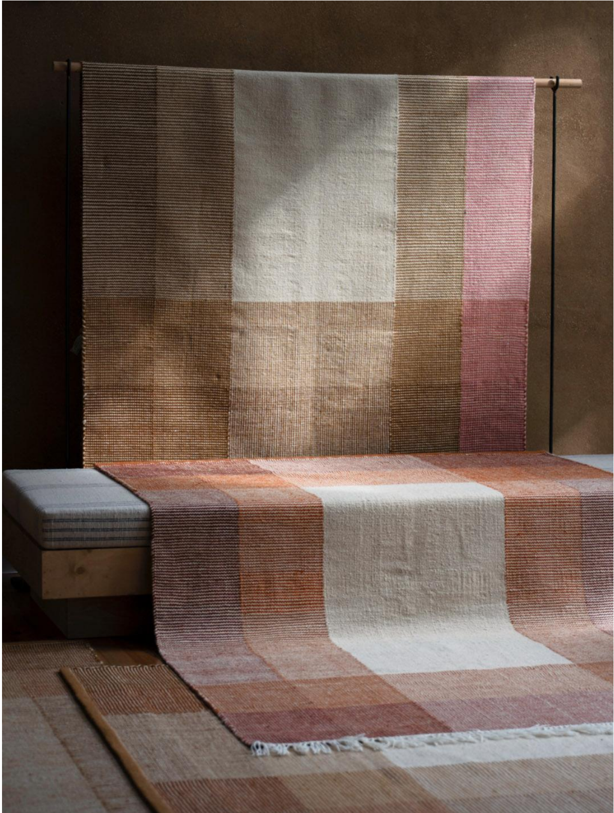
Tapis collection Madras 7 – Anne Claire Lancenet – Mille & Claire